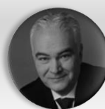
MUDr. Kamal Farhan stínový ministr zdravotnictví, poslanec, člen Výboru pro zdravotnictví, Poslanecká sněmovna Parlamentu České republiky