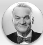
doc. MUDr. Bohuslav Svoboda, CSc. primátor, Hlavní město Praha