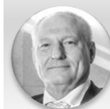
Ing. Zbyněk Pražák, Ph.D. náměstek primátora, statutární město Ostrava