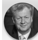
MUDr. Svatopluk Němeček, MBA ministr zdravotnictví v letech 2014 – 2016, Ministerstvo zdravotnictví České republiky; předseda představenstva, Bohumínská městská nemocnice, a.s.