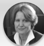
Ing. Helena Rögnerová vrchní ředitelka pro ekonomiku a zdravotní pojištění, Ministerstvo zdravotnictví České republiky