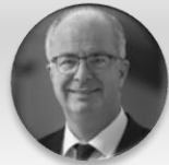
MUDr. Tom Philipp, Ph.D., MBA předseda správní rady, VZP ČR; přednosta kliniky, Klinika revmatologie a rehabilitace 3. LF UK a FTN; poslanec, Poslanecká sněmovna Parlamentu České republiky