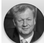
MUDr. Svatopluk Němeček, MBA ministr zdravotnictví v letech 2014 – 2016, Ministerstvo zdravotnictví České republiky; předseda představenstva, Bohumínská městská nemocnice, a.s.