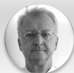
MUDr. Ladislav Slobodník, MBA státní tajemník, Ministerstvo zdravotnictví Slovenské republiky