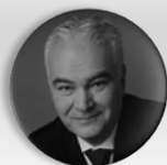
MUDr. Kamal Farhan stínový ministr zdravotnictví, poslanec, člen Výboru pro zdravotnictví, Poslanecká sněmovna Parlamentu České republiky; hejtman, Plzeňský kraj