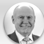
Ladislav Okleštěk hejtman, Olomoucký kraj