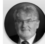
MUDr. Martin Holcát, MBA ministr zdravotnictví v letech 2013 – 2014, koordinátor pro postgraduální vzdělávání lékařů, Ministerstvo zdravotnictví České republiky; exnáměstek, Fakultní nemocnice v Motole