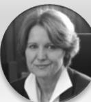
Ing. Helena Rögnerová vrchní ředitelka pro ekonomiku a zdravotní pojištění, Ministerstvo zdravotnictví České republiky