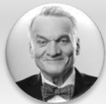
doc. MUDr. Bohuslav Svoboda, CSc. primátor, Hlavní město Praha