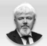
Pavel Štefka náměstek hejtmána pro oblast zdravotnictví, Pardubický kraj