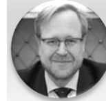
Mgr. Jakub Dvořáček, MHA, LL.M. náměstek ministra, Ministerstvo zdravotnictví České republiky