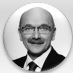
Ing. Pavel Pavlík statutární náměstek hejtmanky pro oblast zdravotnictví, Středočeský kraj