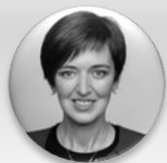
MUDr. Zdenka Němečková Crkvenjaš, MBA předsedkyně, Výbor pro zdravotnictví – Poslanecká sněmovna Parlamentu České republiky