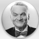
doc. MUDr. Bohuslav Svoboda, CSc. primátor, Hlavní město Praha