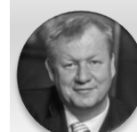
MUDr. Svatopluk Němeček, MBA ministr zdravotnictví v letech 2014 – 2016, Ministerstvo zdravotnictví České republiky; předseda představenstva, Bohumínská městská nemocnice, a.s.