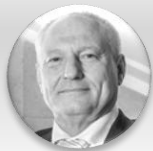
Ing. Zbyněk Pražák, Ph.D. náměstek primátora, statutární město Ostrava