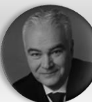
MUDr. Kamal Farhan stínový ministr zdravotnictví, poslanec, člen Výboru pro zdravotnictví, Poslanecká sněmovna Parlamentu České republiky; hejtman, Plzeňský kraj