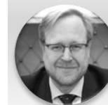
Mgr. Jakub Dvořáček, MHA, LL.M. náměstek ministra, Ministerstvo zdravotnictví České republiky