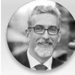
Mgr. Miroslav Žbánek, MPA primátor, statutární město Olomouc