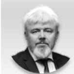
Pavel Štefka náměstek hejtmána pro oblast zdravotnictví, Pardubický kraj