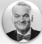
doc. MUDr. Bohuslav Svoboda, CSc. primátor, Hlavní město Praha