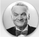
doc. MUDr. Bohuslav Svoboda, CSc. primátor, Hlavní město Praha