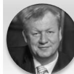
MUDr. Svatopluk Němeček, MBA ministr zdravotnictví v letech 2014 – 2016, Ministerstvo zdravotnictví České republiky; předseda představenstva, Bohumínská městská nemocnice, a.s.