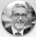
Mgr. Miroslav Žbánek, MPA primátor, statutární město Olomouc