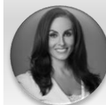
JUDr. Zuzana Dolinková ministryně, Ministerstvo zdravotnictví Slovenské republiky