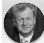
MUDr. Svatopluk Němeček, MBA ministr zdravotnictví v letech 2014 – 2016, Ministerstvo zdravotnictví České republiky; předseda představenstva, Bohumínská městská nemocnice, a.s.