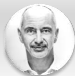
MUDr. Martin Kuba hejtman, Jihočeský kraj

ÚTERÝ 26. 11. 2024, STŘEDA 27. 11. 2024 – CLARION CONGRESS HOTEL PRAGUE – VYSOČANY