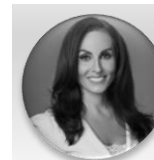
JUDr. Zuzana Dolinková ministryně, Ministerstvo zdravotnictví Slovenské republiky