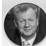
MUDr. Svatopluk Němeček, MBA ministr zdravotnictví v letech 2014 – 2016, Ministerstvo zdravotnictví České republiky; předseda představenstva, Bohumínská městská nemocnice, a.s.