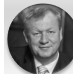
MUDr. Svatopluk Němeček, MBA ministr zdravotnictví v letech 2014 – 2016, Ministerstvo zdravotnictví České republiky; předseda představenstva, Bohumínská městská nemocnice, a.s.