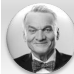
doc. MUDr. Bohuslav Svoboda, CSc. primátor, Hlavní město Praha