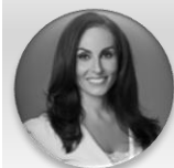
JUDr. Zuzana Dolinková ministryně, Ministerstvo zdravotnictví Slovenské republiky