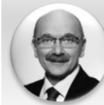
Ing. Pavel Pavlík statutární náměstek hejtmanky pro oblast zdravotnictví, Středočeský kraj